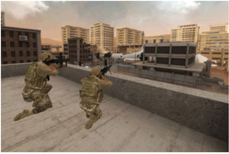
Facebook acquiert Downpour Interactive, le studio derrière le jeu de réalité virtuelle Onward