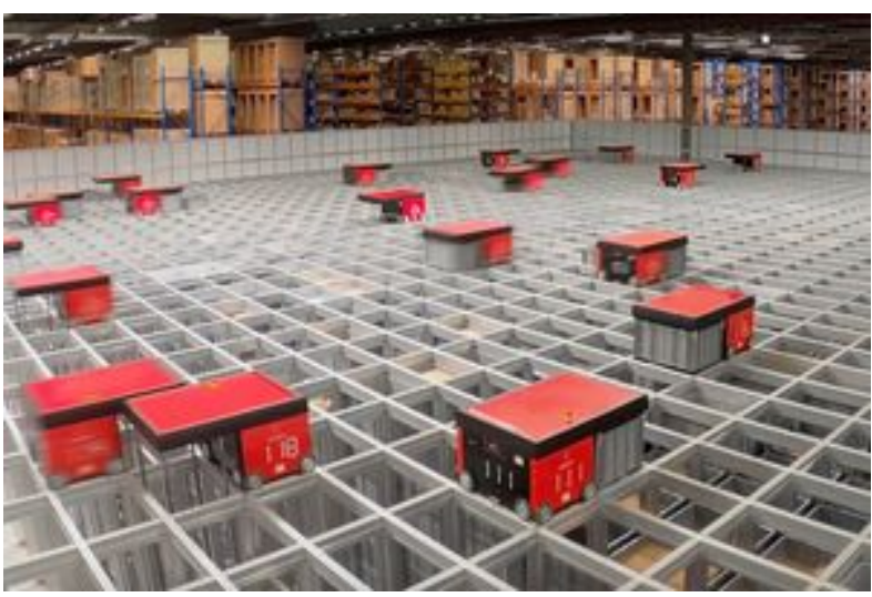
UPS se laisse séduire par les entrepôts automatisés d'AutoStore