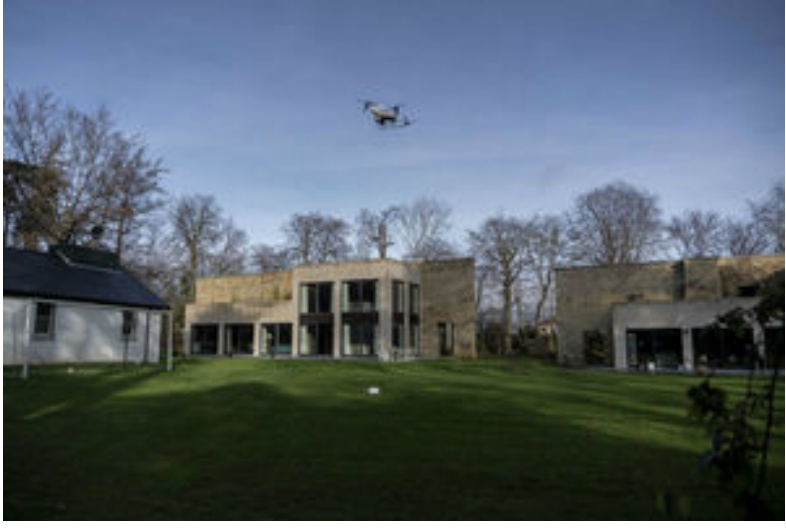
Manna lève 25 millions de dollars pour élaborer des projets pilotes de livraison par drone aux Etats-Unis